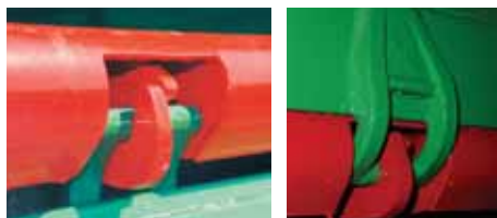
Sigurno zatvaranje sa čvrstim viljuškastim bravama