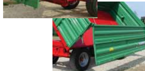
Različite mogućnosti otvaranja stranica