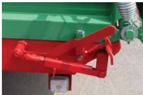
Jednostavno centralno zatvaranje stranice sa ručicom