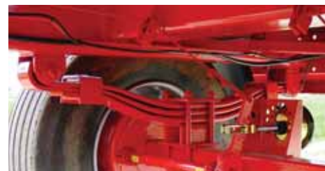
Parabolične opruge kod prikolice DP 1400 garantuju najveću nosivost i sigurnost