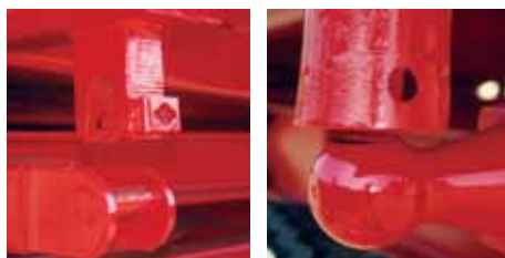
Sigurnosna brava, velika kugla i precizni konusno cevni nosač, garantuju sigurnu vezu izmedju gornje i donje šasije