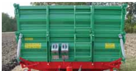
Stabilne i sigurne stepenice, podložni klinovi čine deo serijske opreme