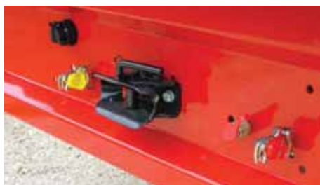
Sigurnosni lim sa dodatnim priklopom i priključkom za kočenje, kipovanje i svetla