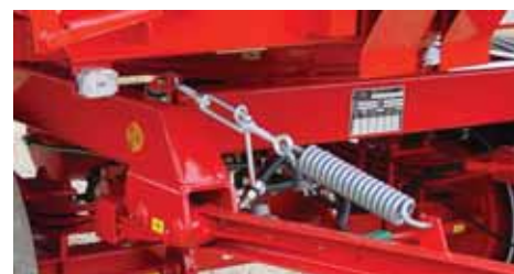
Sopstvena opruga drži rudu u visini poteznice traktora