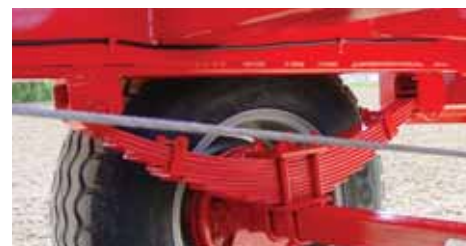
Sopstvene opruge omogućuju mirnu i sigurnu vožnju na njivi i na putevima