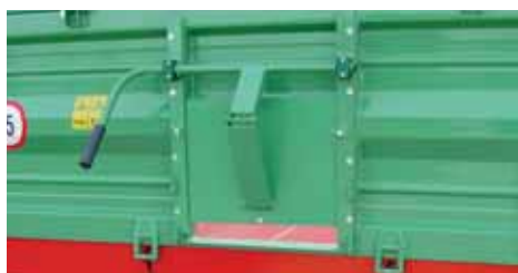
Ispust za zrna na zadnjoj stranici