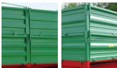
Stabilni demontažni stubovi sa zatvaračima, koji omogućavaju jednostavno i sigurno zatvaranje