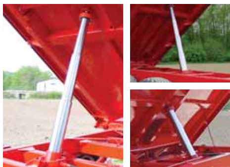
Jaki, višestepeni hidraulični cilindar, dovoljan za istovar svakog tereta